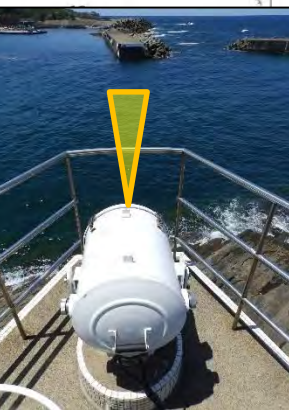
鷹巣港西方照射灯